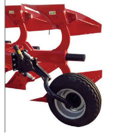
Pneu de réglage pour profondeur.