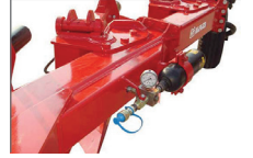
Mécanisme pour réglage de pression de sécurité hydraulique.